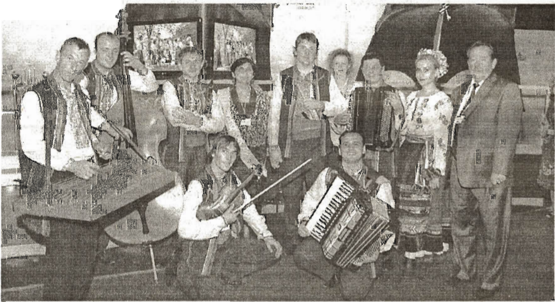
Український стенд і музики вразили «Апімондію».

Сьогодні цивілізований світ не хоче їсти цукор і лікуватися хімією — він повертається до тисячолітніх джерел життя і обирає... мед. На всіх континентах «нектар богів» стає рушієм харчового, сільськогосподарського, фармацевтичного, косметичного виробництва. Продукти бджільництва тепер в усьому — в помадах, хлібі, інгаляторах, жувальних гумках, мазах, вині... Україна у «медових справах» задніх не пасе: за виробництвом меду ми — перші в Європі й п'яті у світі. В нас прадавня культура бджільництва й надзвичайні економічні перспективи. Мед може і повинен стати світовим брендом української нації — таким як французький сир і вино чи російська горілка. І світ уже дав нам карт-бланш: у 2013 році до України з'їдуться на конгрес бджолярів з усіх куточків планети. Адже на цьогорічному всесвітньому форумі у Франції ми переконали усіх: Україна — медовий край. Як це відбувалося, бачила і «Україна молода».